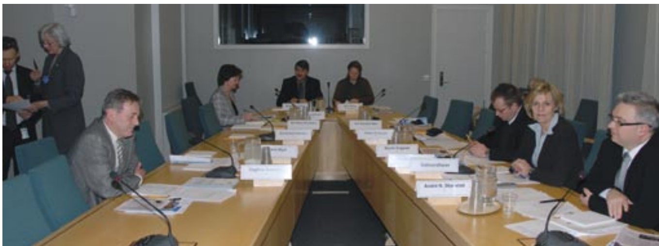
Arbeids- og sosialkomiteen

- Vi har sett tilfeller der trygdekontoret har vært involvert med utredninger. Sakene har vært godt belyst og det er fattet vedtak hvor forsikringsselskapet forlanger en ny spesialisterklæring. Mange av våre medlemmer har erfart dette. De er ute etter erklæringer som kan trekke dette i tvil og at de blir til fordel for forsikringsselskapene. Vi har mistanke om at